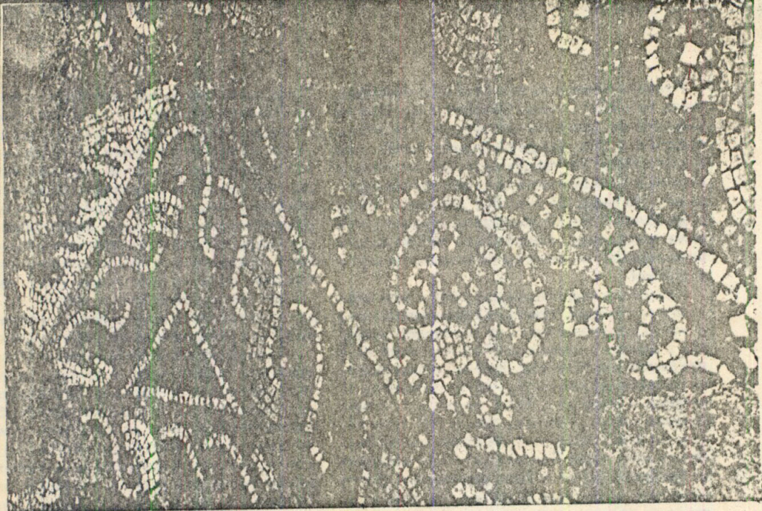
Мозайки от късноантичните сгради, които сега се намират под зданието на „Корекон“

през последния четвърт век дават представа за характера на сградите.